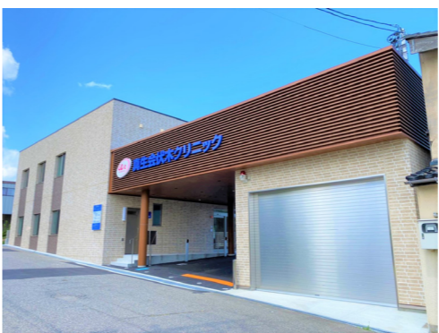
クリニックの外観

はい、大きく違います。真生会富山病院では外科と緩和ケア内科を担当していました。こちらでは加えて一般内科、発熱外来、慢性疼痛ケ