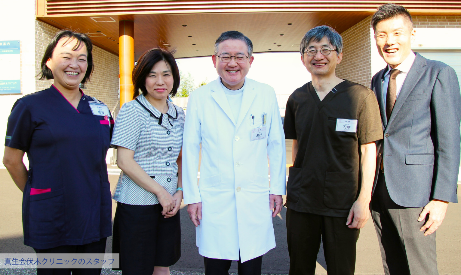
真生会伏木クリニックのスタッフ