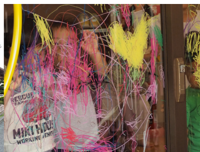
ユニークな遊びをする子どもたち

木の子ハウスは想像力のかたまりのような場所です。ユニークな作品、遊びが至るところに広がっています。