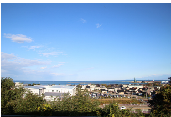
2階の多目的ホールから眺める風景