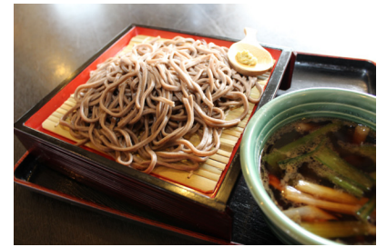
鴨せいそば 880円（税込）

お漬物がついた大変お得なセットです。次に人気なのは鴨せいそば（880円）。こちらのそばは、黒くて太い麺が特徴です。そばの実の中でも、栄養豊富と言われる表面の黒い色素部分を多く使っているため、黒い麺になるのだそうです。麺肌がつるつるしており、喉越しよくいた