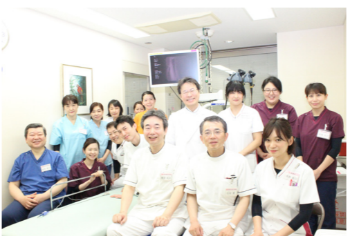
消化器センターのスタッフ

り、さまざまな肝疾患、また肝臓がんの治療を行っています。その他、漢方診療、ピロリ除菌、栄養治療など、各医師の独自性を発揮しています。お通じ外来には、難治性便秘で悩む患者さんが県外からも訪れます。がん患者さんには緩和ケア内科と連携し、心に寄り添う診療を行います。スタッフ全員が一致団結して、患者中心の消化器診療を実現します。どうぞよろしくお願いたします」。