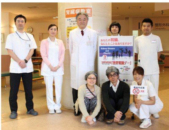
腎臓病教室の出演者で記念撮影

「慢性腎臓病をCKDと呼ぶようになります。世界中で普及活動が行われています。CKDが心筋梗塞や脳卒中と深い関係にあるからです。全国調査では何と8人に1人がCKDに該当すると判明しました。CKDかどうかは検尿と採血で簡単に分かります。腎機能が正常かどうかを示す検査が推算GFRです。これが低いと言われた人は要注意です。生活習慣を改めるきっかけにもなります。正常人