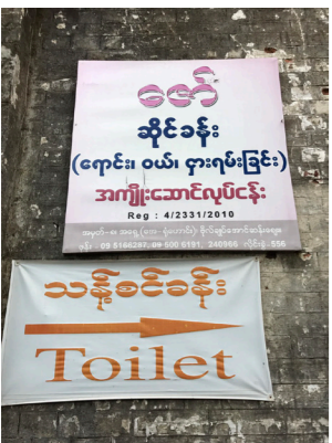
街なかの看板 (ミャンマー語)