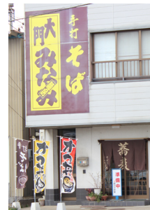
大門総合会館の隣にあります

だけです。当院からも近いいため、診察の帰りに立ち寄るのを楽しみにされている方もあるとのこと。「女子会」や「おやじ会」といった、各種飲み会の相談にも応じてくれます。